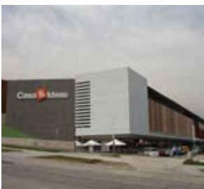
Paseo Los Dominicos

Arquitecto Pontificia Universidad Católica. Vice Presidente de la Asociación de Oficinas de Arquitectos de Chile (AOA). Destacan sus obras el nuevo Casino de Los Angeles, El Espacio Riesco en Santiago, El Complejo de Edificios Patio Mayor ubicado en la ciudad Empresarial y el Centro de Diagnóstico Mater.