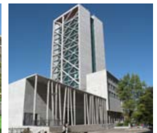
Casino Los Angeles